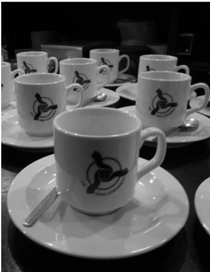
De nieuwe koffiekopjes van De Drie Stromen, gekocht van de opbrengsten 'Kunstmarkt'

MAANDBLAD VAN DE PROTESTANTSE GEMEENTE TE AMSTERDAM ZUIDOOST