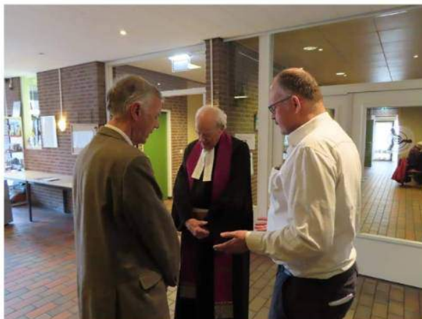
Het consistoriegebed is een gebed van de dienstdoenden voor de dienst begint.

5 mei Jeremia 32:36-41, Lucas 24:35-48 12 mei Numeri 27:12-23 Johannes 10:22-30 19 mei Deut. 6:1-9, Johannes 13:31-35 26 mei Joël 2:21-27, Johannes 14:23-29 30 mei 2Koningen 2:1-15, Lucas 24:49-53