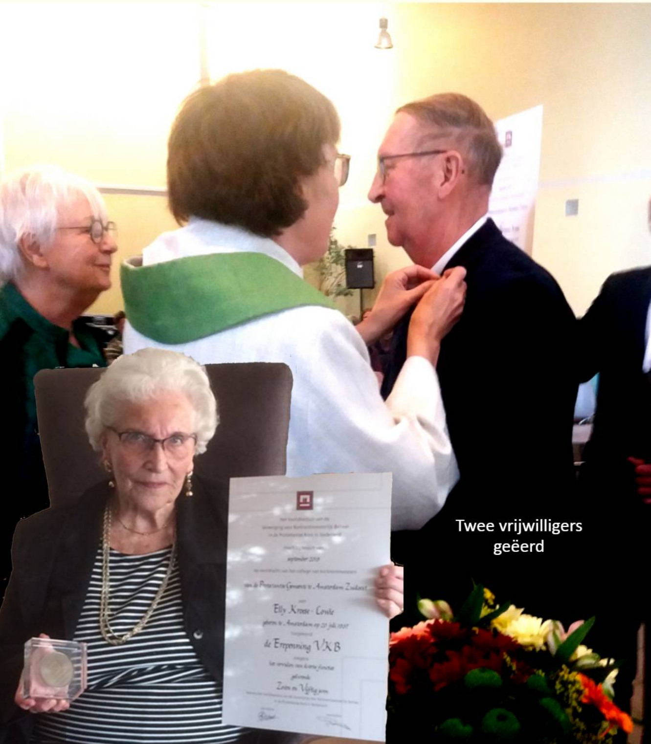
Twee vrijwilligers geëerd