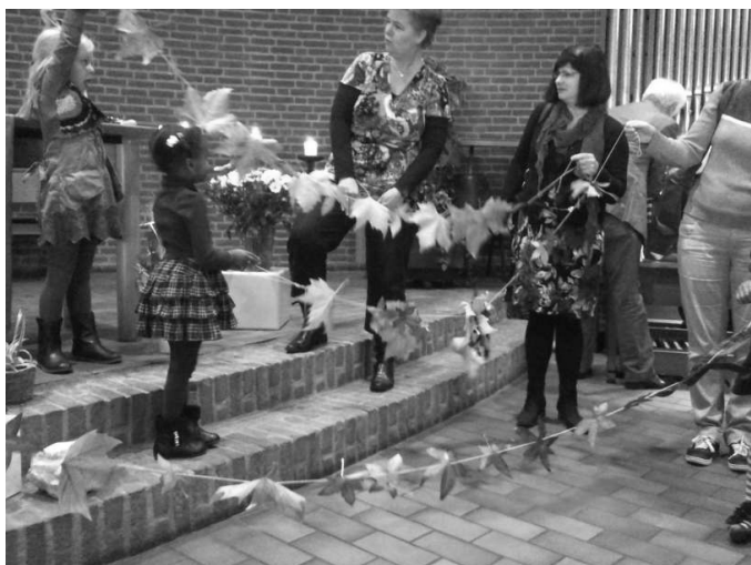
activiteit van de Kindernevendienst