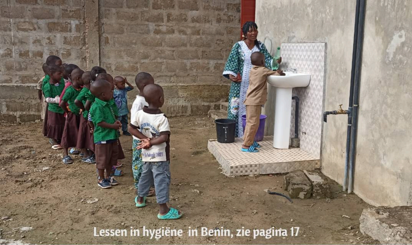
Lessen in hygiëne in Benin, zie pagina 17